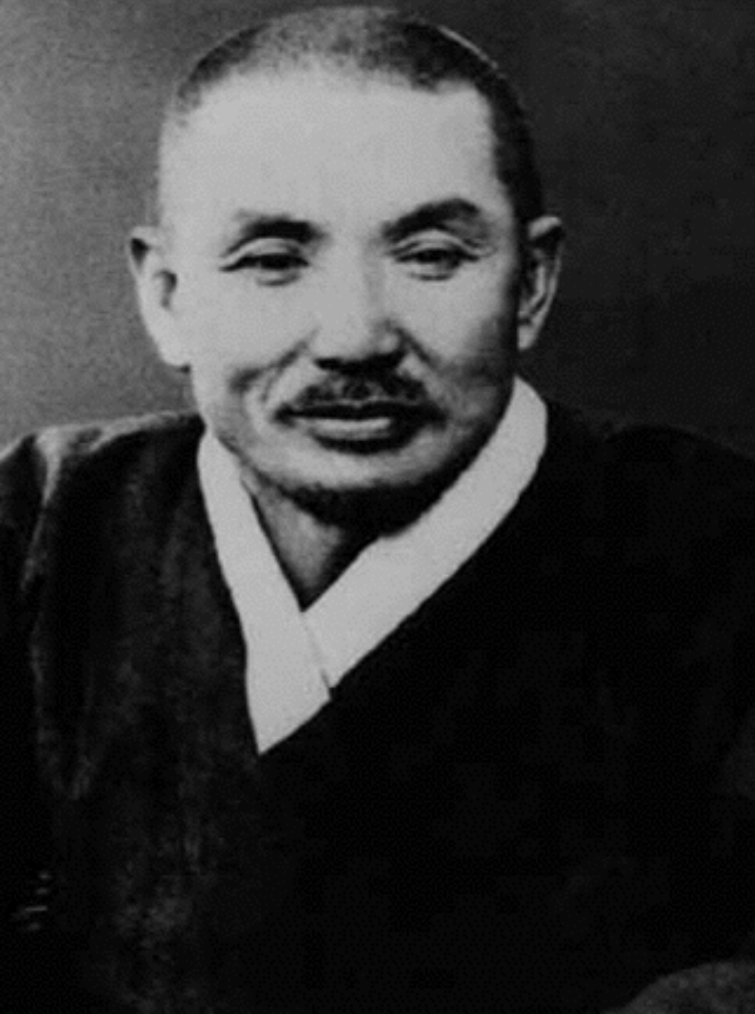
주기철 목사님 Pr. Ju Ki-Chul